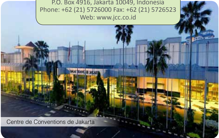
Centre de Conventions de Jakarta

Jl. Jend. GatotSubroto, Jakarta 10270 P.O. Box 4916, Jakarta 10049, Indonesia Phone: +62 (21) 5726000 Fax: +62 (21) 5726523 Web: www.jcc.co.id