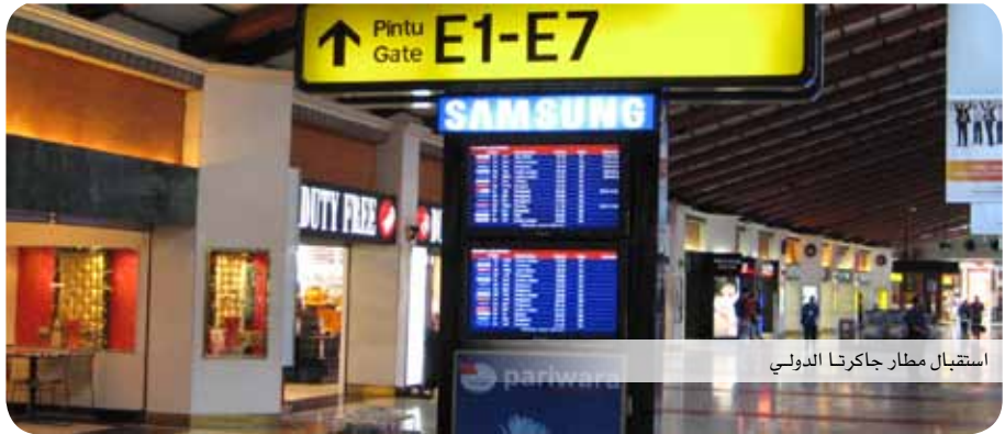
استقبال مطار جاكرتا الدولي

لا يجوز للمسافرين إلى جاكرتا أن يجلبوا إليها مواد محظورة كالأسلحة النارية والذخائر والمخدرات.