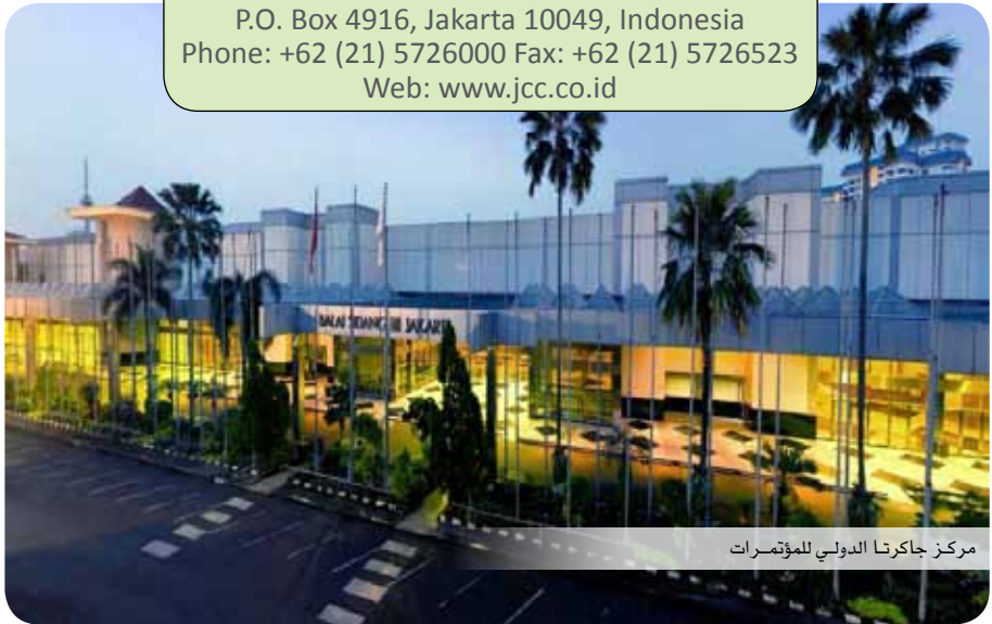
مركز جاكارتا الدولي للمؤتمرات

Jl. Jend. GatotSubroto, Jakarta 10270 P.O. Box 4916, Jakarta 10049, Indonesia Phone: +62 (21) 5726000 Fax: +62 (21) 5726523 Web: www.jcc.co.id